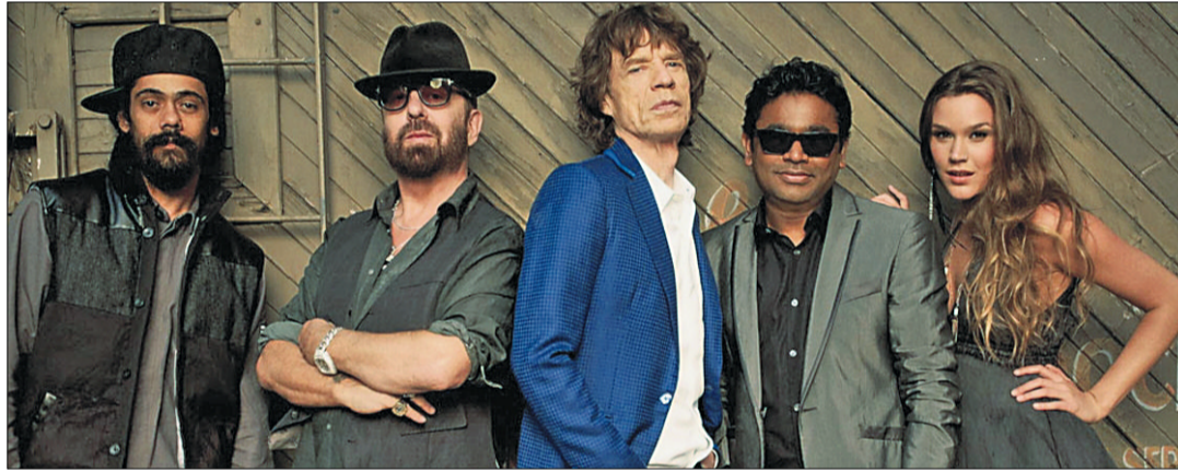
A.R. Rahman, Dave Stewart, Mick Jagger, Damian Marley und Joss Stone, v.l.nr.

LONDON. Rolling-Stones-Legende Mick Jagger (67) hat mit der britischen Soulsängerin Joss Stone (24), dem jüngsten Bob-Marley-Sohn Damian (33), dem indischen Komponisten Allah Rakha Rahman (45, „Slumdog Millionär“, der für die Filmmusik zwei Oscars erhalten hatte) und Dave Stewart (60) von den Eurythmics eine Band der Superlative geformt. Jagers „SuperHeavy“ wird am 16. September das gleichnamige Debütalbum auf den Markt bringen. Die erste Single „Miracle Worker“ ist seit einigen Tagen im Radio – auch auf Südtirol 1 – zu hören. Jagger hält sich dabei im Hintergrund. Er und Stewart wollten eine Band mit Vertretern aus ganz unterschiedlichen musikali-